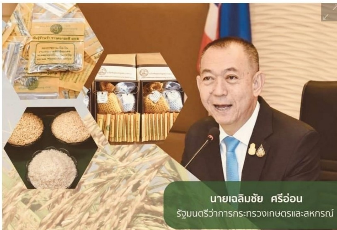
นายเจลิ้มชัย ศรีอ่อน รัฐมนตรีว่าการกระทรวงเกษตรและสหกรณ์